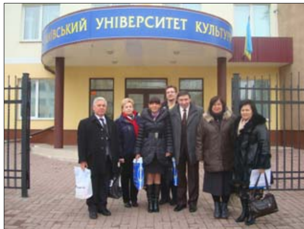
Delegacja Wszechnicy przed filią Kijowskiego Uniwersytetu Narodowego Kultury i Sztuki