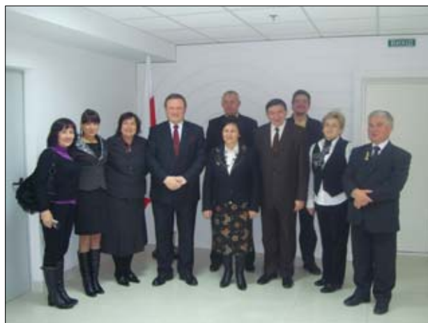
Uroczyste spotkanie w konsulacie Rzeczypospolitej Polskiej