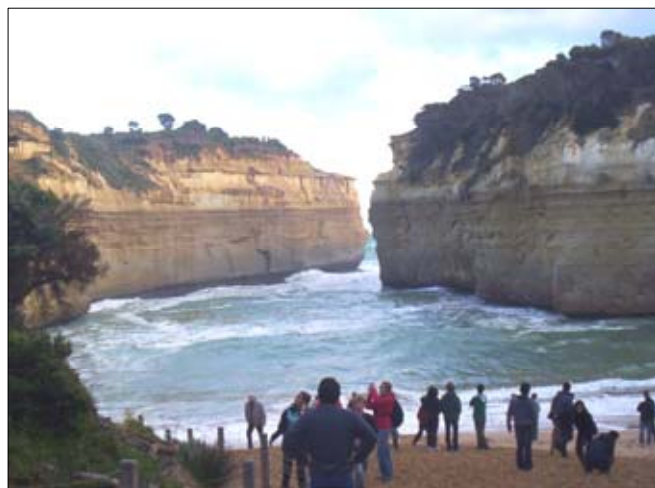
Widok na zatoczkę