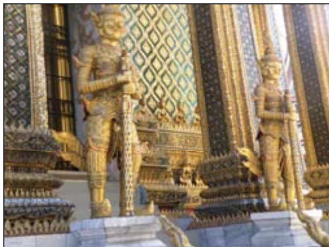
Mityczne jaksze , strzegące Świątyni Szmaragdowego Buddy

Posążek o wysokości 60 cm, wykonany z jadeitu (szlachetny kamień) przyciąga tysiące wyznawców buddyzmu. Posąg ma ciekawą historię. Trzy razy do roku jest ubierany, w przeszłości w czasie suszy król nakazywał tygodniowe modły. Mury świątyni Szmaragdowego Buddy podtrzymują dziesiątki mitycznych figur, przedstawiających mityczne postacie, które są połączeniem zwierząt i ludzi. Podziw wzbudzają umieszczone między budynkami sześciometrowe posągi istot mitycznych, zwane jakszami. Z wyglądu groźne, mają za zadanie odstraszać niepożądanych gości.