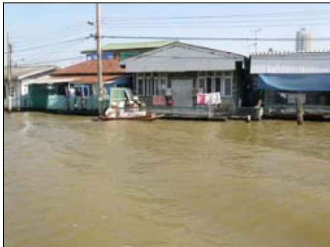
Domy nad Klong Bangkok Noi

w pływających na łodziach sklepach. Z klongów korzystają też: policja, straż pożarna i służby medyczne. Ciekawe, że linie energetyczne zawieszono na słupach wystających z wody.