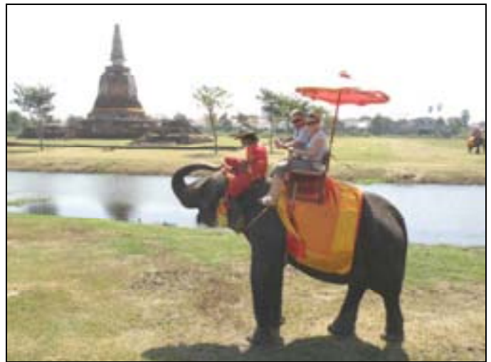
Przejażdżka na słoniach to stała atrakcja turystyczna

Po powrocie do Bangkoku i krótkim odpoczynku w hotelu, udajemy się na zwiedzanie Bangkoku. Tym razem łapiemy tuk-tuki i udajemy się do centrum rozrywki. Tuk-tuki to zmotoryzowane riksze, w których do napędu wykorzystuje się głośno hałasujące silniki motocyklowe. Nazwa tych rikszy pochodzi od wydawanego przez nie dźwięku. Część z nas odwiedza lokalne knajpki i restauracje, inni zaglądają na stragany z pamiątkami. Na ulicach jest spokojnie i bezpiecznie.