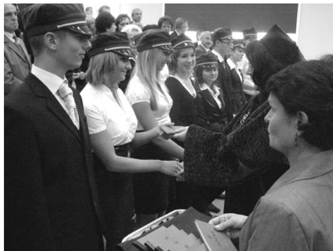
Uroczyste ślubowanie i immatrykulacja studentów I roku