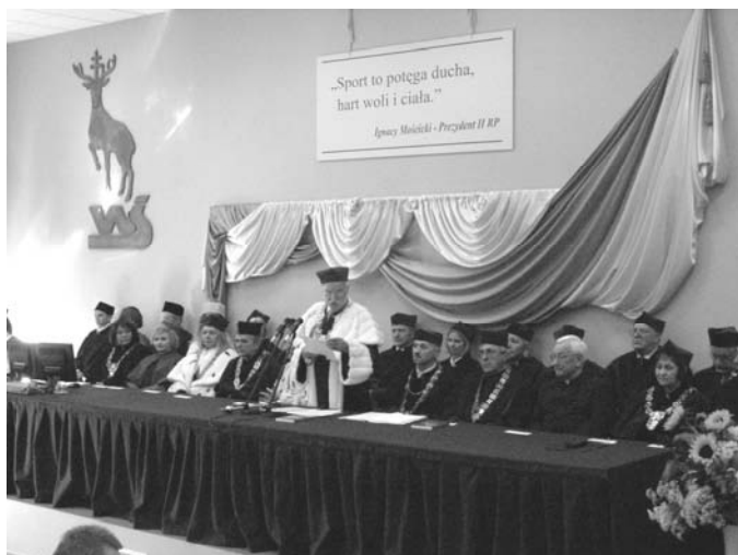
JM Rektor powitał przybyłych na inaugurację roku akademickiego gości, pracowników i studentów