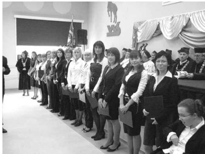
Najwybitniejsi studenci otrzymali stypendium Rektora „Primus Inter Pares”