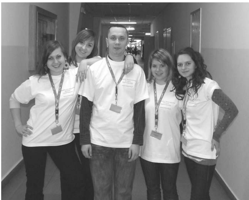
Studenci fizjoterapii podczas olimpiady