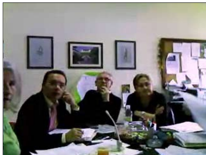
Hiszpańscy uczestnicy wideokonferencji

Współpraca zagraniczna Wszechnicy Świętokrzyskiej rozszerza się na Comenius – kolejny program adresowany do europejskich szkół wyższych. W jego ramach nasza uczelnia nawiązała kontakt z uniwersytetami w Hiszpanii, Francji, Anglii, Słowacji, Portugalii i na Węgrzech. Uczelnie wspólnie przygotowują plan projektu M4TECS ( Mobility for Teacher European Citizenship Strategy – Strategia na rzecz Mobilności Nauczycieli w Kontekście Obywatelstwa Europejskiego ).