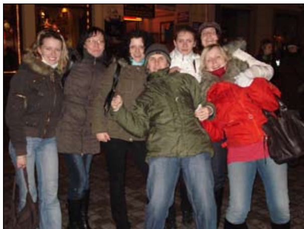
My na ulicach Lublina