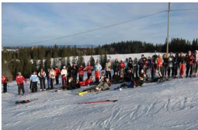
Uczestnicy drugiego turnusu