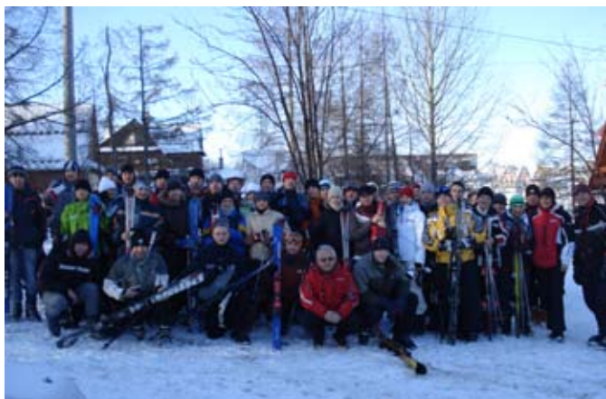
Uczestnicy pierwszego turnusu

Wbrew sceptykom i niedowiarkom udanie zakończyła się akcja obozów zimowych dla studentów Wszechnicy Świętokrzyskiej, które jak co roku zorganizowano w Bukowinie Tatrzańskiej. W dwóch turnusach uczestniczyło 100 osób, w tym 19 studentów stacjonarnych drugiego roku wychowania fizycznego (pobyt obowiązkowy, w ramach programu studiów).