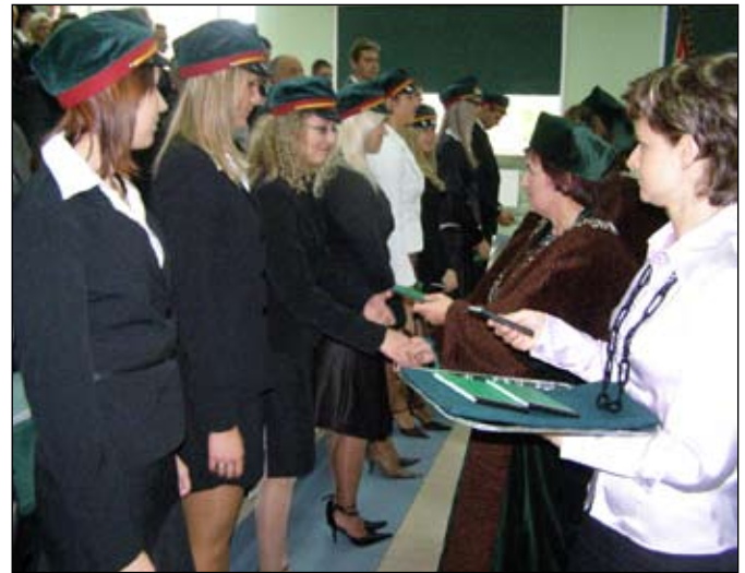
Wręczenie indeksów studentom pierwszego roku