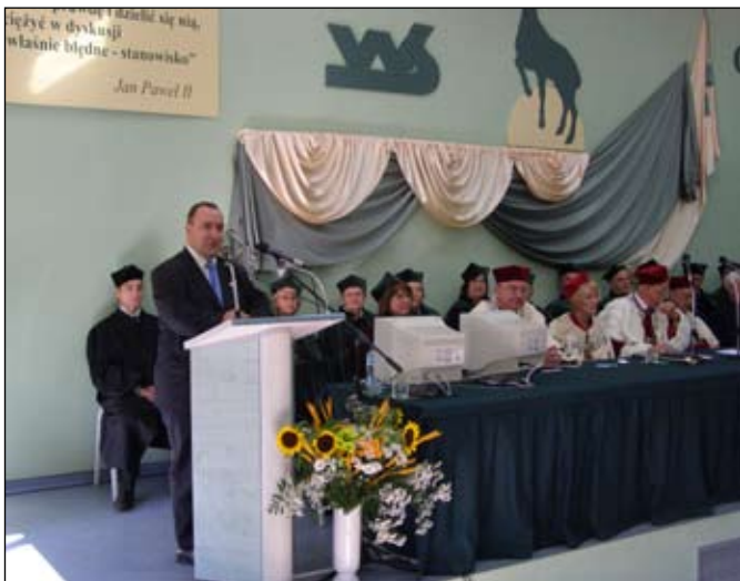
Wystąpienie wicepremiera Przemysława Gosiewskiego