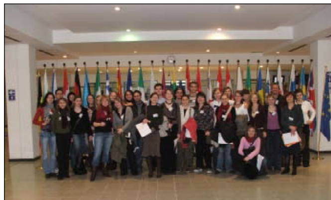
Wizyta w Parlamencie Europejskim