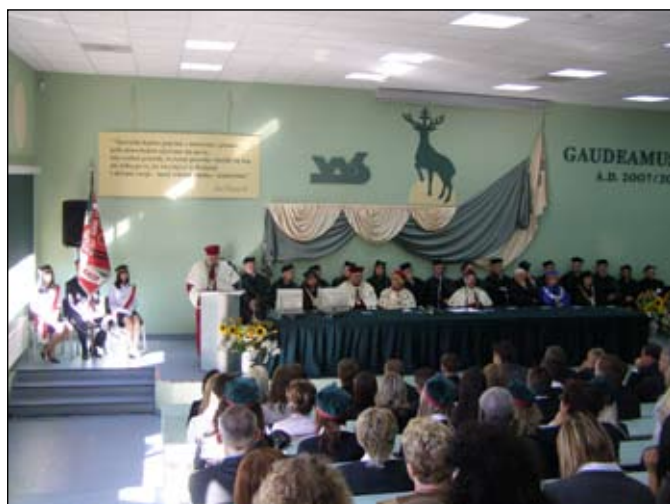
Przemówienie inauguracyjne JM Rektora