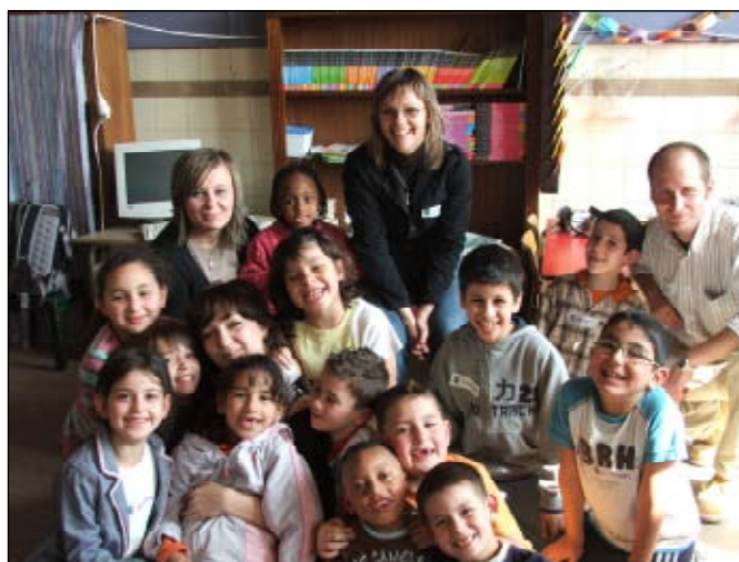
Praktyki w szkole podstawowej

munication, Emotions and Expression, Teaching in Europe, Flemish Culture and Expressions, Diversity and Education. Dowiedzieliśmy się wiele o problemach Belgów (np. religijnych, kulturowych i rasowych) oraz o sposobach radzenia sobie z nimi. Poznaliśmy historię i sztukę ich kraju.