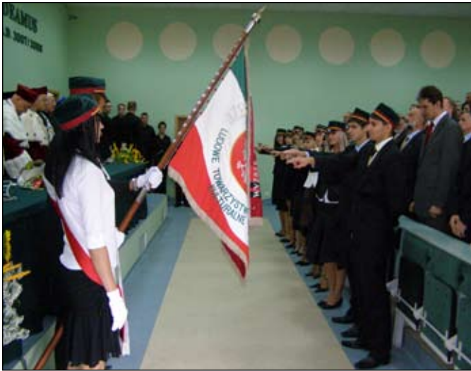
Ślubowanie studentów pierwszego roku