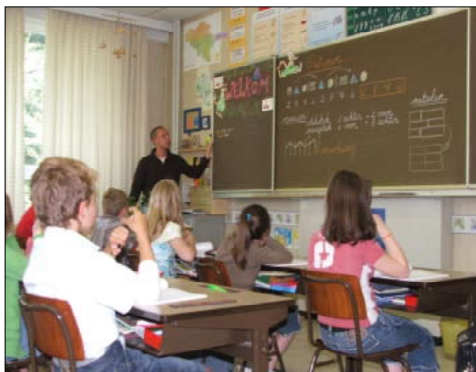
Zajęcia w European School

Byłyśmy w Brukseli od 5 lutego do 5 maja 2007 roku. Nasz wyjazd miał na celu integrację studentów z różnych krajów Europy, poznanie europejskich systemów edukacyjnych, różnych kultur i narodowości. Mogłyśmy też doskonalić znajomość języka angielskiego.