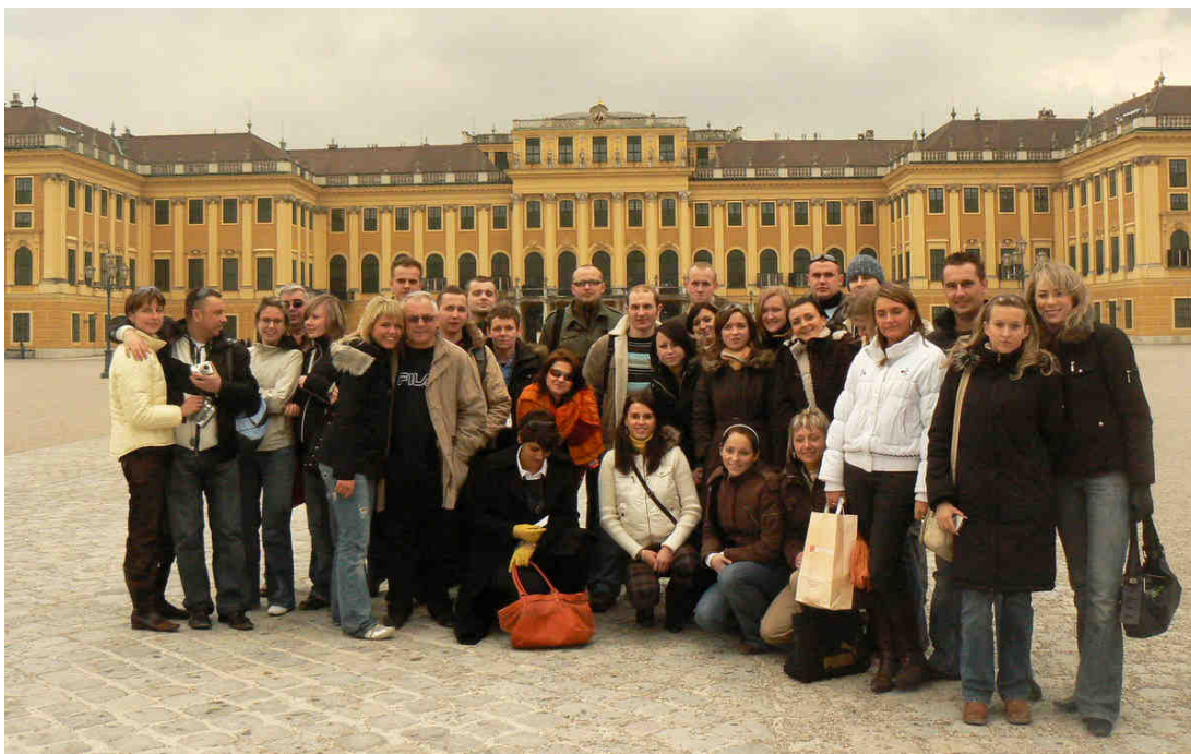
Barokowy pałac Schönbrunn, zbudowany z przepychem, jest najczęściej zwiedzanym zabytkiem Wiednia. Znaleźli się tam również uczestnicy naszej wycieczki.

Zakończył się kolejny cykl szkolenia przyszłych pilotów wycieczek krajowych i zagranicznych. W miesiącach grudzień 2006 – marzec 2007 trzydziestu jeden studentów naszej uczelni brało udział w zajęciach praktycznych i teoretycznych. Egzamin wewnętrzny zaliczyło 30. uczestników kursu.