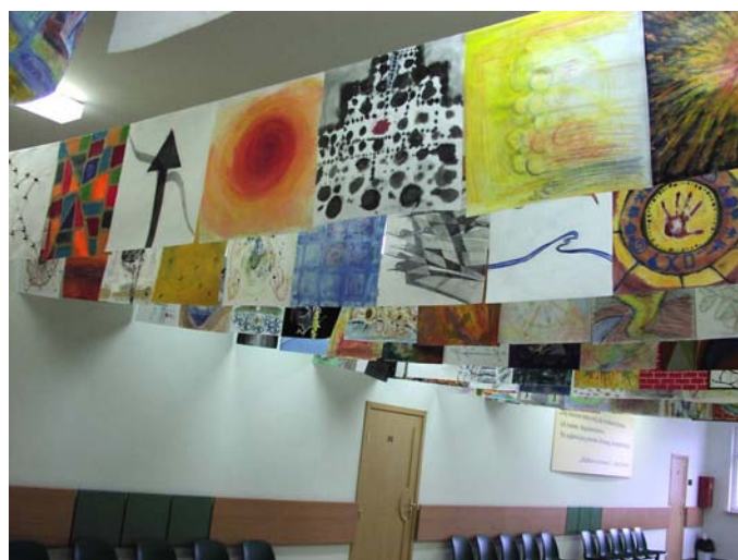
Zdjęcia robione były przy okazji otwarcia Galerii „Na piętrze”