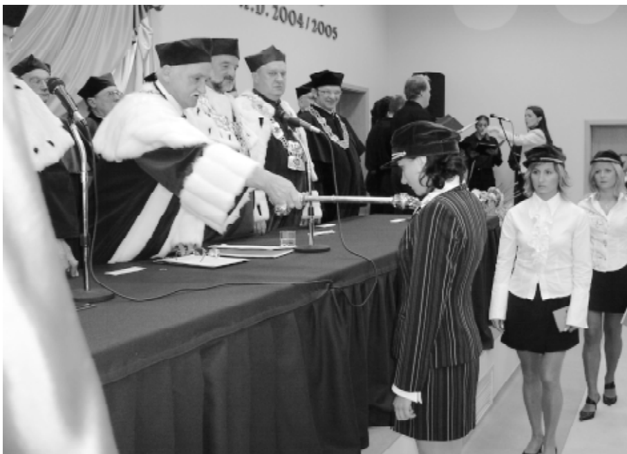
Immatrykulacja studentów I roku