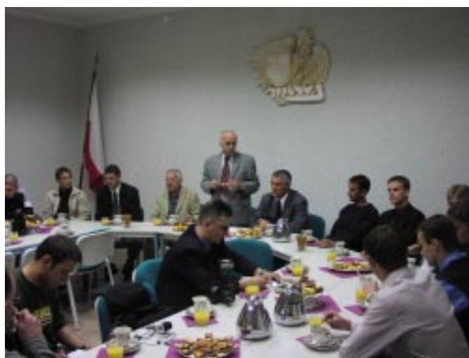
Spotkanie Rektora z mistrzami Polski w piłce nożnej wyższych szkół niepaństwowych