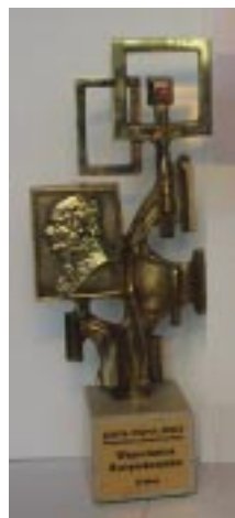
Złota Firma 2002

Zaszczytny tytuł „ Złotej Firmy ” Województwa Świętokrzyskiego i Statuetkę Staszica Wszechnica Świętokrzyska otrzymała rok wcześniej, w październiku 2002 roku. Podczas Koncertu Galowego „Złota Gala” w Wojewódzkim Domu Kultury w Kielcach, w oparciu o decyzję Wielkiej Kapituły i Plebiscytu Radia Kielce,