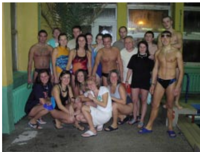
Mistrzostwa Szkół Wyższych w Pływaniu, listopad 2003