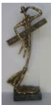
Złota Miotła 2002

Również w październiku 2002 roku, Wszechnica Świętokrzyska została zwycięzcą V edycji Plebiscytu o Złotą Miotłę , ogłoszonego przez Urząd Miasta Kielce. Uczelnia wyłoniona została z grupy 40 posesji i otrzymała statuetkę oraz dyplom przyznany za estetykę i zagospodarowanie terenu zielenią.