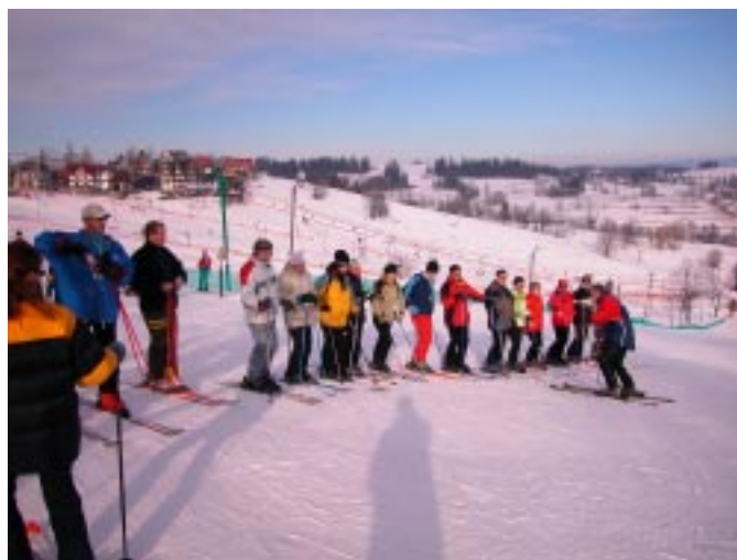
Bukowina Tatrzańska, styczeń 2004