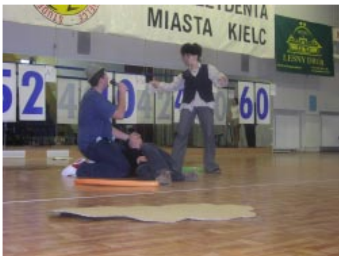
minął zbyt szybko.

Organizatorami tegorocznej Wiosny Studenckiej byli: Akademia Świętokrzyska, Politechnika Świętokrzyska, Wszechnica Świętokrzyska, Wyższa Szkoła Ekonomii i Administracji oraz Wyższa Szkoła Umiejętności. Do współorganizowania tej szczytnej imprezy chęci nie wyraziła Wyższa Szkoła Handlowa. Nam prawdziwym studentom pozostaje jedynie współczuć kolegom z WSH. Życie studenckie nie ogranicza się bowiem tylko do nieoficjalnych imprez „u kumpla z grupy 2” czy spotkań na piwie po zajęciach. To również, a może przede wszystkim oficjalne imprezy, inicjatywy mające na celu promowanie naszego środowiska.