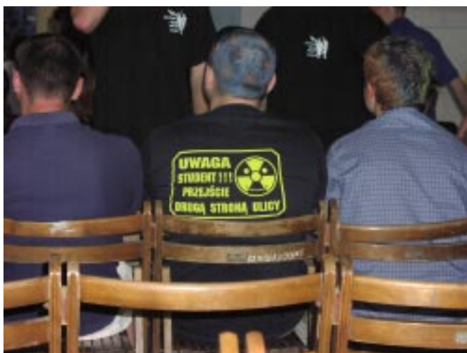
jak to zwykle bywa...